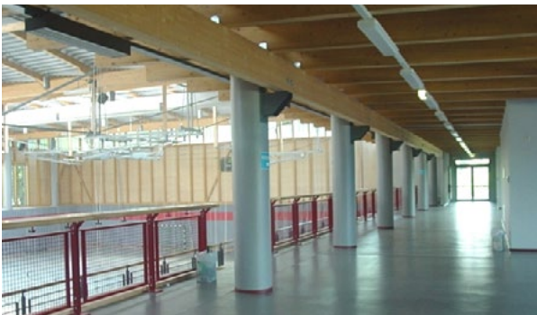
Sporthalle am BSZ-Zittau

Bewerbungsschluss für die Aufnahme der Ausbildung im September des darauffolgenden Jahres ist der 1. Oktober .