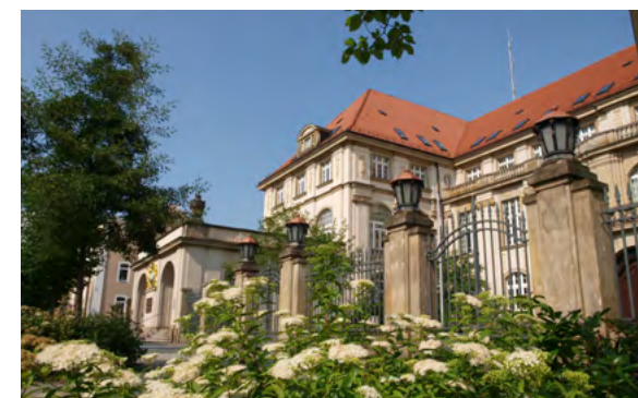
Landratsamt Bautzen, Bahnhofstraße 9